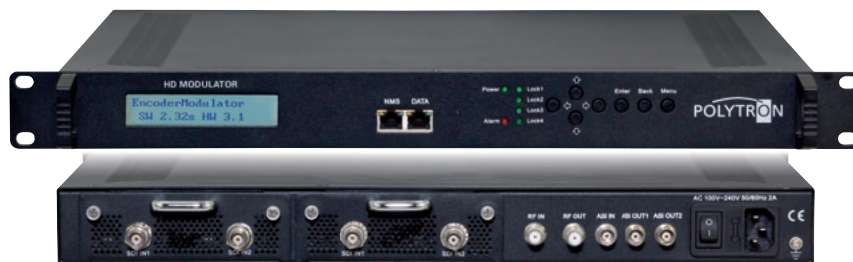
Vorderseite / Front