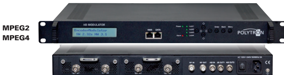
Vorderseite / Front