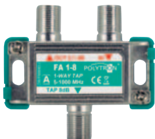
FA 1-8 1-fach Abzweiger 1-way tap